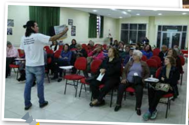
Encontro do Coletivo de Aposentados do mês de maio