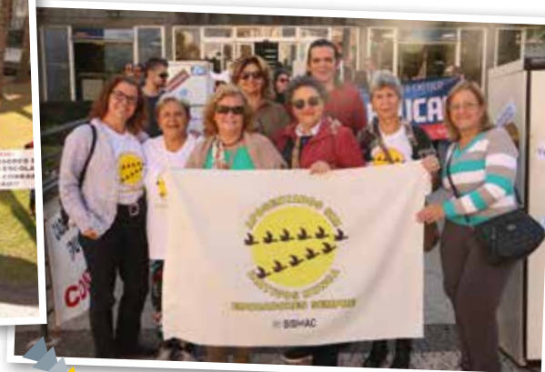
Coletivo de Aposentados também marcou presença no ato