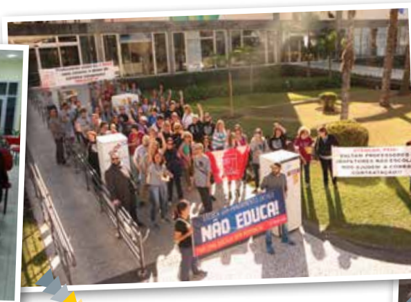
Ato do magistério no dia 30 de maio contra o congelamento de contratações, carreira e salário